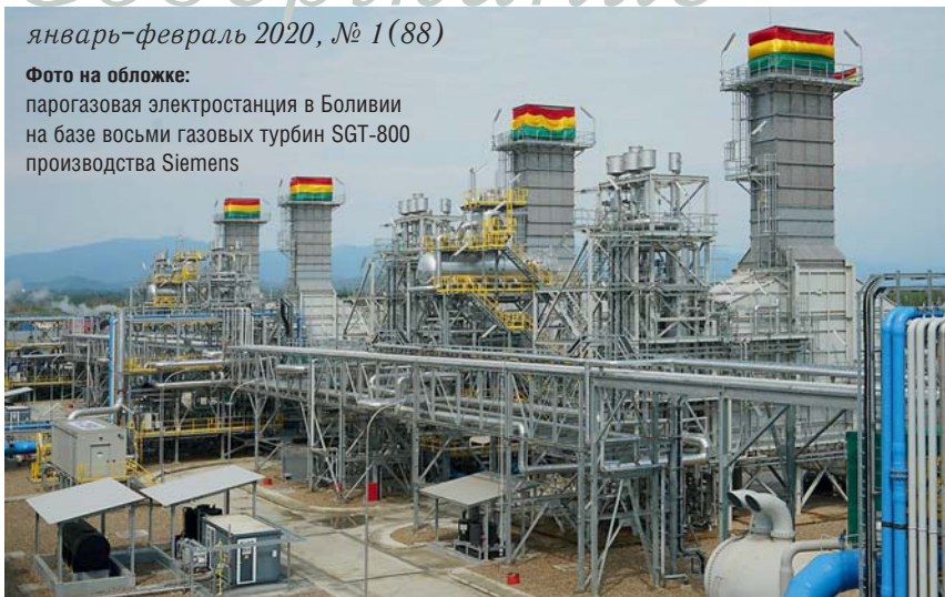
Фото на обложке: парогазовая электростанция в Боливии на базе восьми газовых турбин SGT-800 производства Siemens