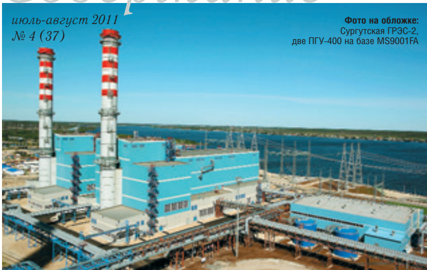
Фото на обложке: Сургутская ГРЭС-2, две ПГУ-400 на базе MS9001FA