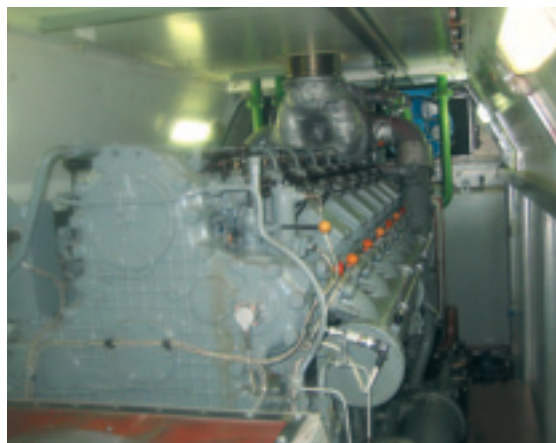
Электростанция Звезда-1650ВК-05М3 на базе многотопливного двигатель-генератора производства Коломенского завода

рудования связи, АСУ ТП, КИП, электрооборудования и комплектующих в РФ» мы подняли проблему качества отечественных электроагрегатов, производства генераторов, а также возможности импортозамещения энергетического оборудования.